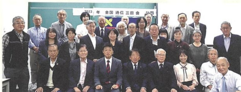
会場にて出席者全員で記念写真撮影