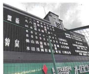
写真上/レフトスタンドから撮影した試合終了時のメンバーとスコア。斜めですが、見事に8-2で慶應義塾が107年振りの甲子園優勝です！ 写真右上/入り口での記念写真です。 写真右下/優勝行進。この後直ぐに大雨。

3対2で迎えた4回裏の相手先頭は見事に2塁打を打ち、4回裏はピンチとなりました。ここで先発の鈴木君が頑張りました。6番と7番を連続三振に取った後、8番打者のピッチャーゴロが1塁悪悪送球となり、3塁。キャッチャーがマウンドに駆け寄り、