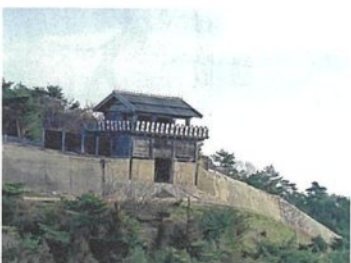
謎の古代山城鬼ノ城