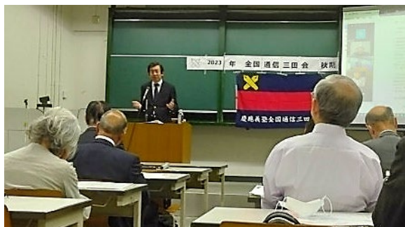
(全国幹事会の様子)

14日の幹事会、15日の連合三田会に参加しました。幹事会は現地:三田(リアル)と ZOOM で開催、40人程出席したでしょうか、懇親会も30人程参加、盛り上がりました。新記念館は勇壮、圧巻です。式典は慶応の伝統と格式を感じました。(迫田)