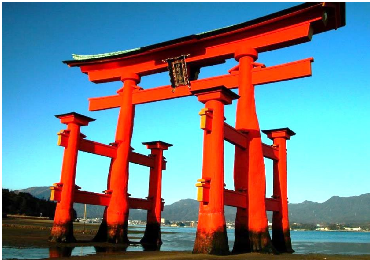
安芸の宮島「厳島神社の大鳥居」