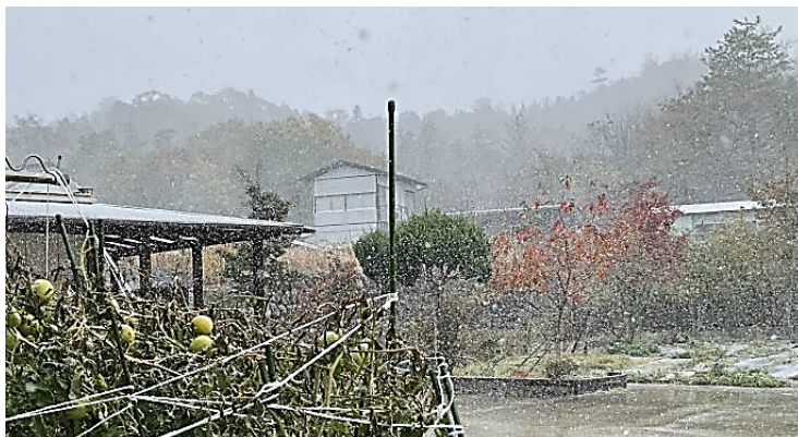
:先月のある朝の風景: (東広島市八本松町にて) トマト(夏)・モミジ(秋)・降雪(冬) …春は撮影者の脳内!?

10 時に家を出た時は柿の木が折れていなかったのが、帰ってきた時は折れており多数のカラスが空を舞い、鳴いていました。このことから昼間に熊が出たと推定しました。この道は日常よく通る生活道です。(迫田)