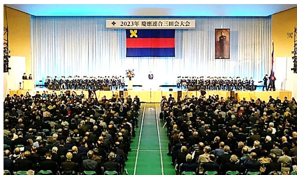
(10月15日 連合三田会大会)