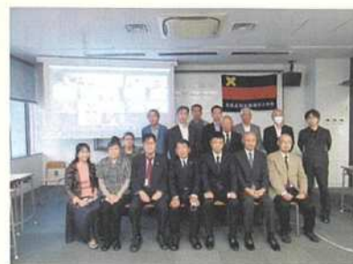
集合写真(背景にZoom参加者)