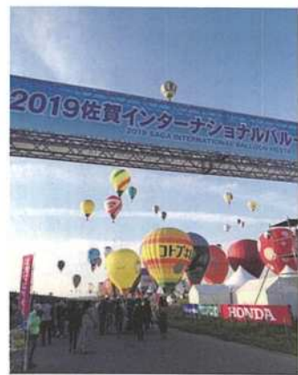
バルーンフェスタ

これに気がついたとき、老人の住みやすい街だと思いました。老人が住みやすいなら全ての人が住みやすいはず。大きな街に行きたい人は電車で40分で博多駅に着きます。坂道を歩きたい人は車で30分千メートルの山の登り口に行けます。また、