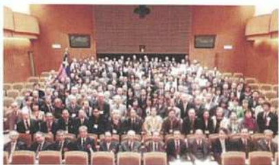
全国通信三田会卒業15000人達成記念式典