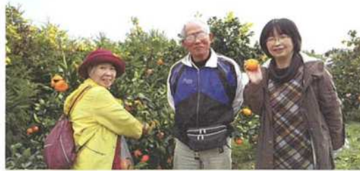
左から小河会長・由元顧問・愛知の岩田会長