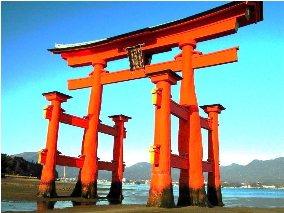
安芸の宮島「厳島神社の大鳥居」